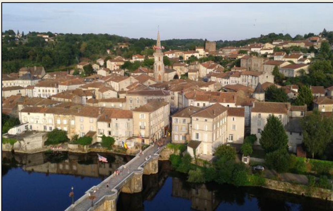
La ville de Confolens sur la Charente