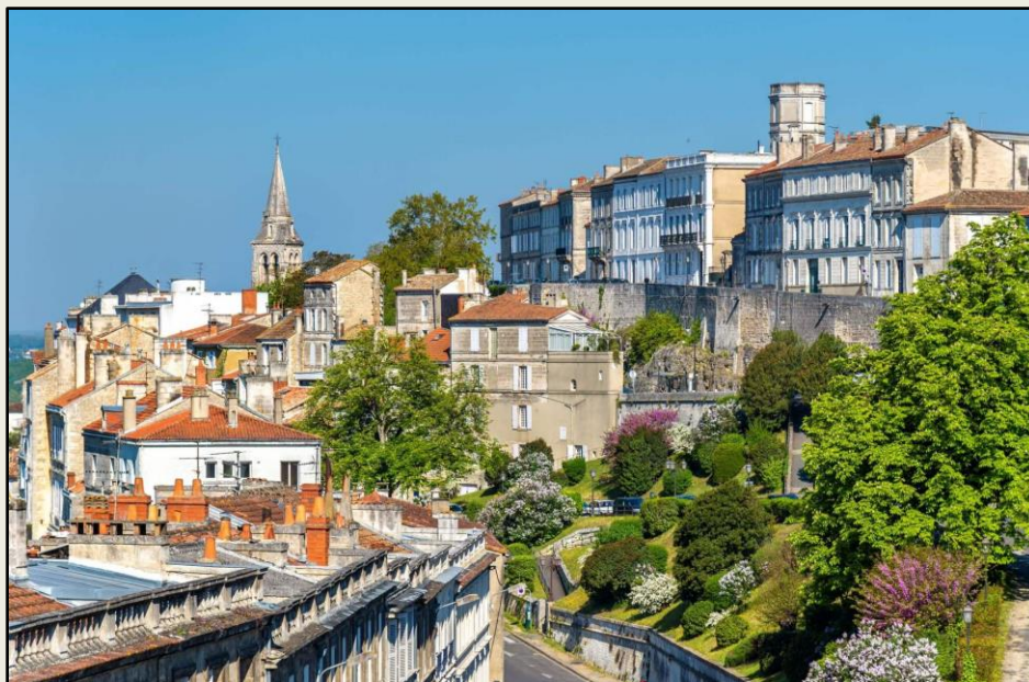
La ville d'Angoulême dans le département de la Charente